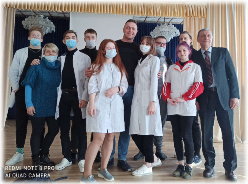
REDMI NOTE 8 PRO AI QUAD CAMERA